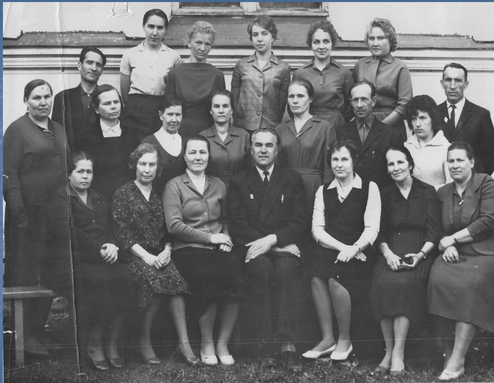
Коллектив учителей Алексейковской школы. 1966 год.