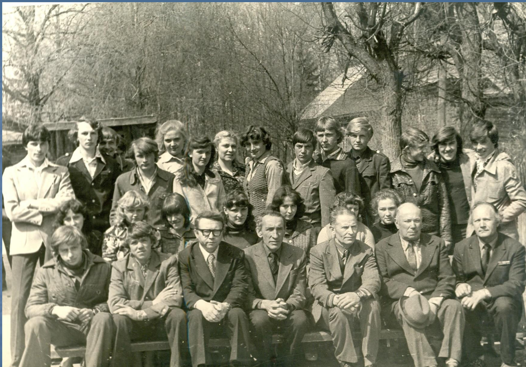
Дружный коллектив учителей и учеников. 1982 год