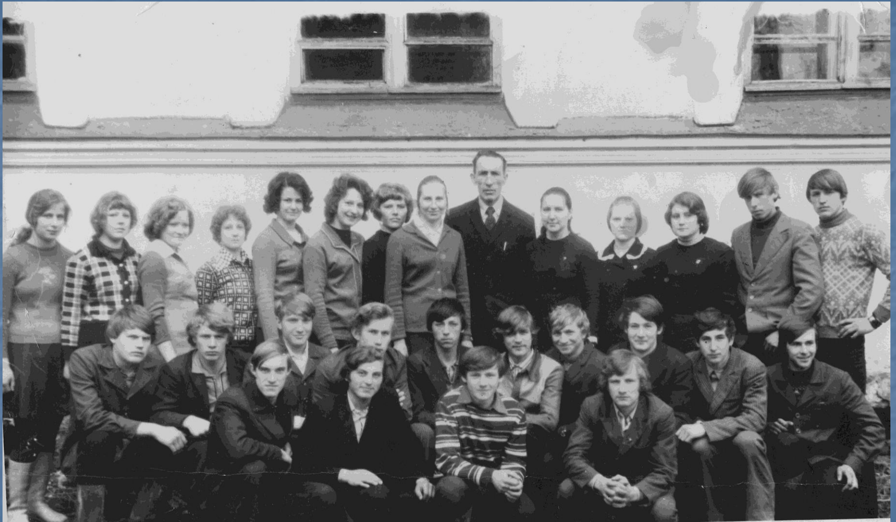
Николай Николаевич прежде всего был учителем- наставником и воспитателем молодого поколения.1976 год.