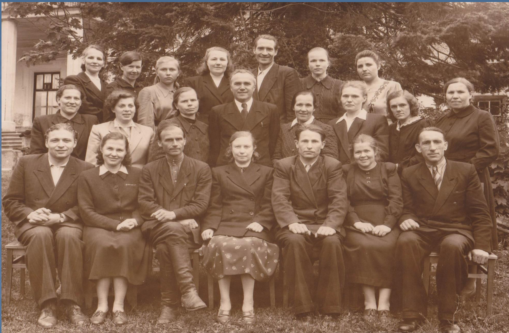
Коллектив учителей. 1957 год.