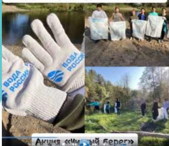
Акция «Чистый берег»