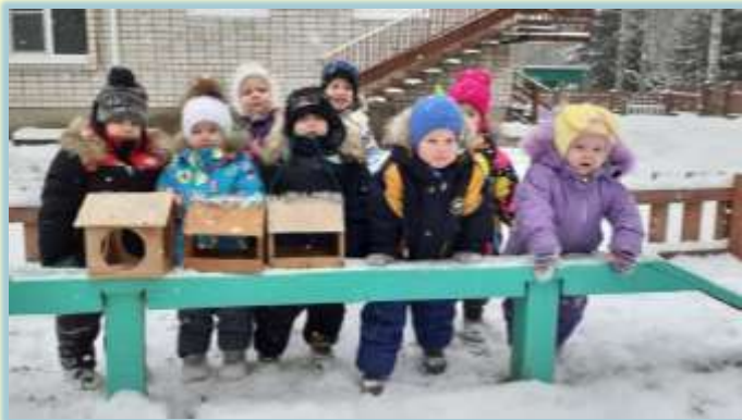
«Каждой пичужке - своя кормушка»